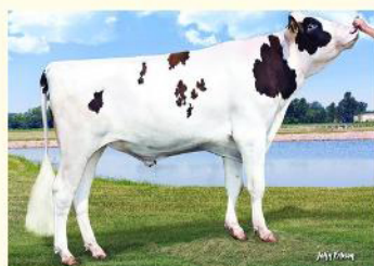
PAT RED - Străbunicul matern