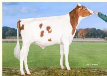
ALASKA RED - Bunicul matern