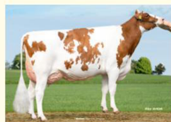
DREAMGIRL - Fiică PERFECT AIKO