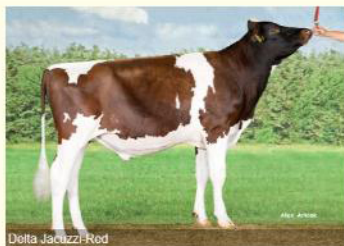
JACUZZI - Tatăl