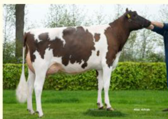
WARSI - Semisoră