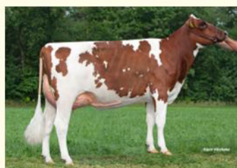
FABILOLO - Semisoră