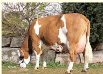
Bunica paternă EPOCHE