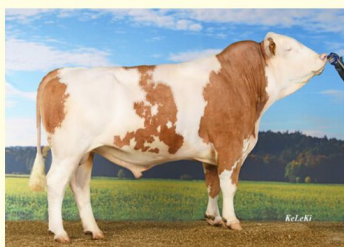
Bunicul patern - IRREGUT