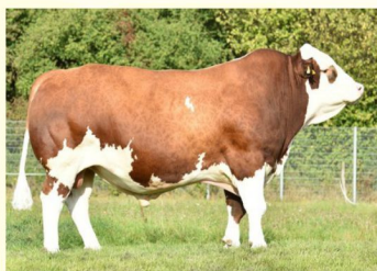
Bunicul matern MAHANGO Pp