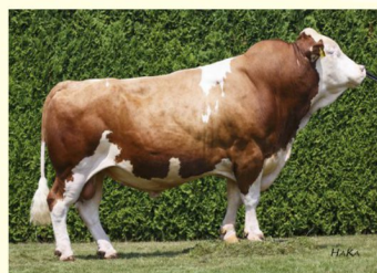
Străbunicul patern HARIBO