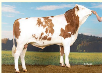
Tatăl - IQ P*S