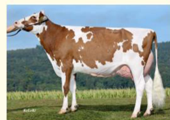
ALYSSA RED - Mama