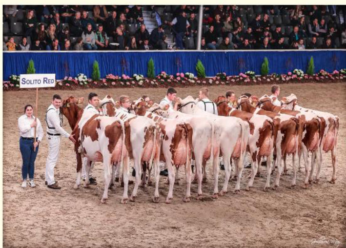
Grupă de fiice SOLITO RED