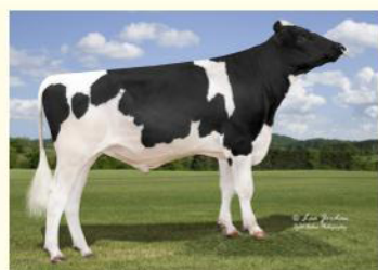
ALTAZEOLITE-ET - Tatăl