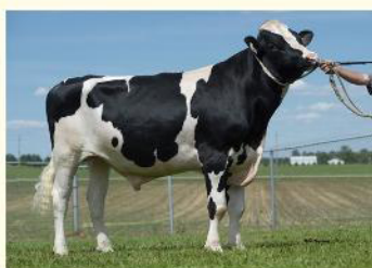
MARIUS - Străbunicul patern