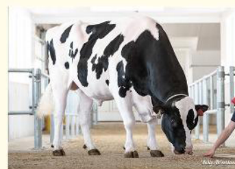
PURSUIT - Străbunicul matern