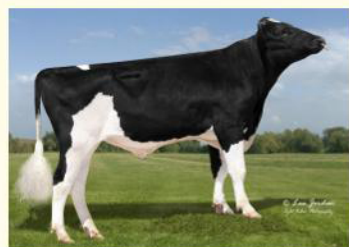
ALTAZAZZLE - Bunicul patern