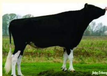
ZENITH - Străbunicul matern/patern